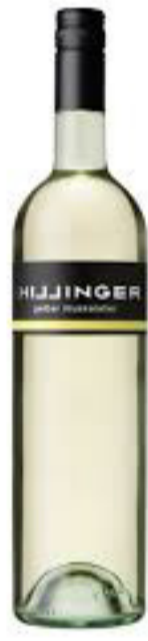
LEO HILLINGER GELBER MUSKATELLER Bílé víno suché 245 Kč / ks s DPH 0,75 l