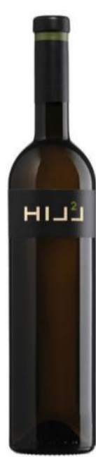
HILLINGER HILL 2 Bílé víno suché 689 Kč / ks s DPH 0,75 l