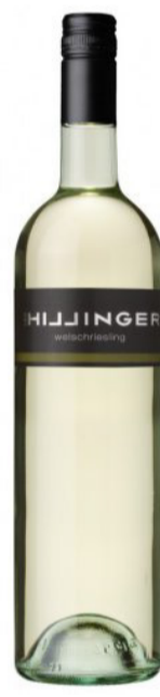
LEO HILLINGER WELSCHRIESLING Bílé víno suché 240 Kč / ks s DPH 0,75 l