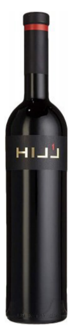
HILLINGER HILL 1 Červené víno suché 945 Kč / ks s DPH 0,75 l