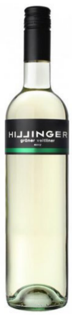
LEO HILLINGER GRUNER VELTLINER Bílé víno suché 245 Kč / ks s DPH 0,75 l